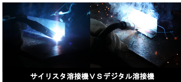
サイリスタ溶接機 vs デジタル溶接機

■このセミナーは、これまで溶接について専門の学習をすることができなかった方や、アーク現象について学ぶ機会が少なかった方などには必ず役に立つ内容です。セミナーの一部を紹介すると・・・